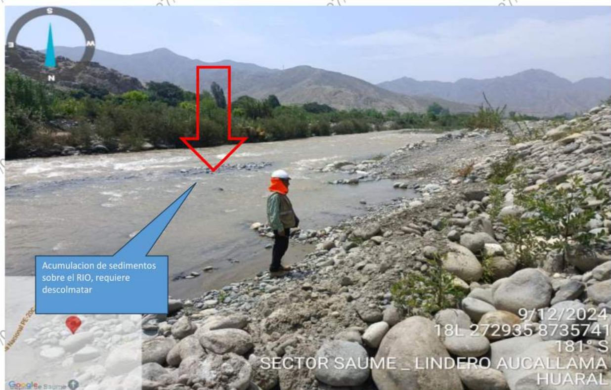
FIGURA N°03: EN LA TEMPORADA DE MAXIMAS AVENIDAS, EL RIO CHANCAY SE SEDIMENTA Y REALIZA DESVIO DE AGUAS OCACIONANDO, DETERIORO DE LA AREA AGRICOLAS.