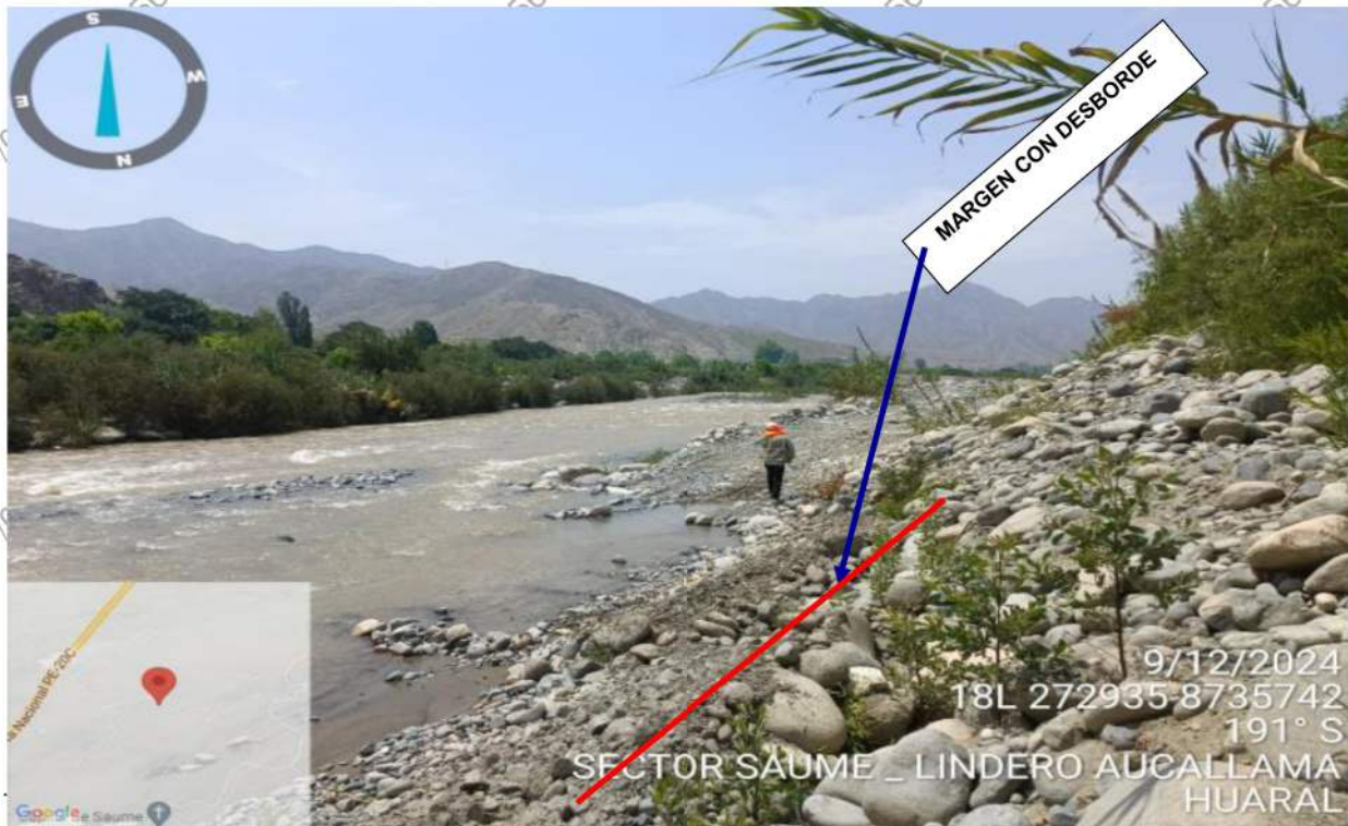
FIGURA N° 02: RIO CHANCAY, EXPUESTO ANTE UN DESBORDAMIENTO EN EL LADO MAS CERCANO A LA ZONAS DE CULTIVOS.