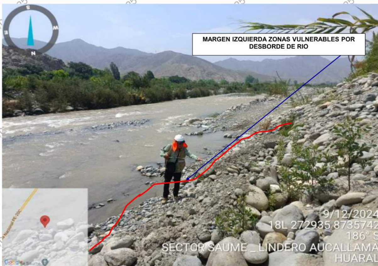
FIGURA N° 01: TRAMO CRÍTICO EN EL RIO CHANCAY, DISTRITO DE AUCALLAMA, PROVINCIA HUARAL.